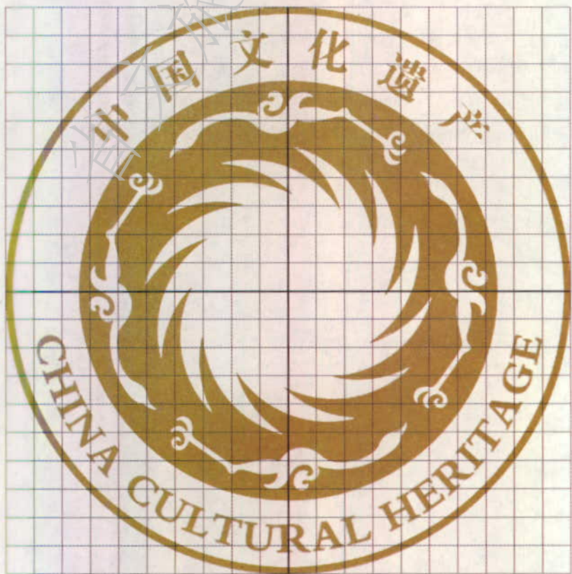
图 6 中国文化遗产标志英文形式网格比例