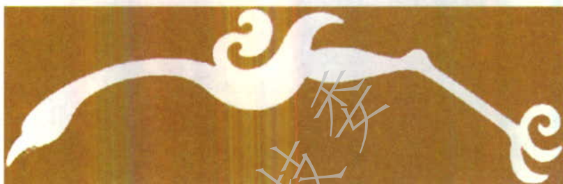
图 4 中国文化遗产标志中鸟的形式

5.2.4 鸟应符合以下特征:爪大身小,颈、腿长且粗,翅膀短小,喙微下钩,短尾下垂,爪有三趾(见图 4)。