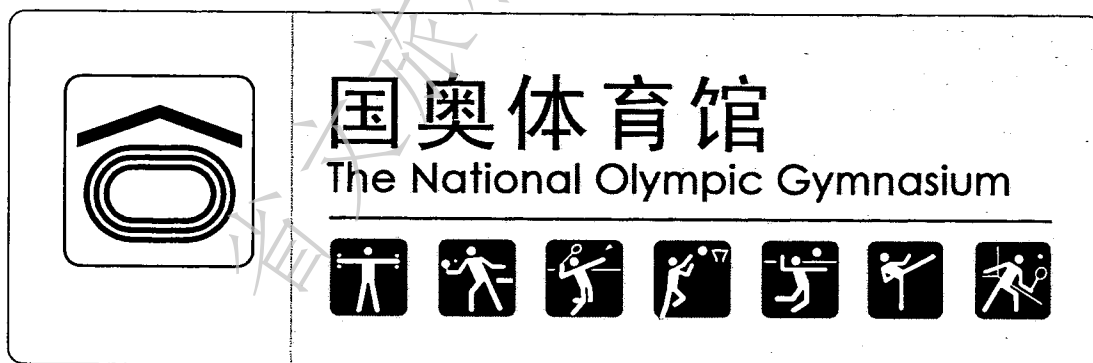
图3 体育建筑名称标志示例