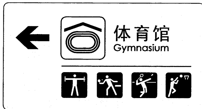
图 1 单个体育建筑的导向标志示例