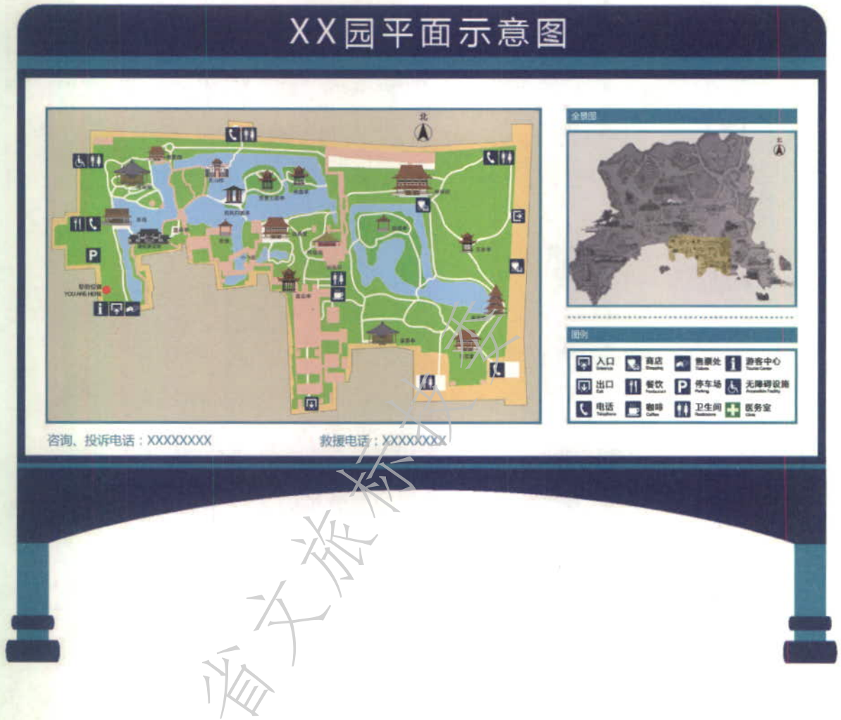
图 A.3 辅以全景图的平面示意图示例