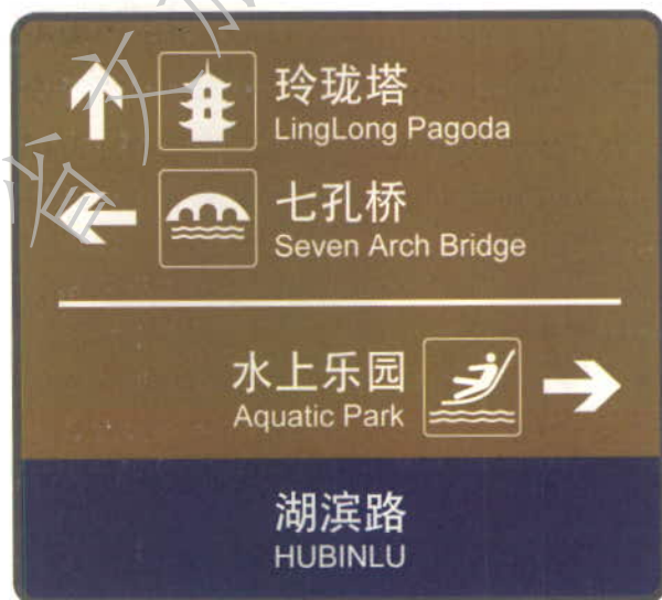
图 1 多种信息的设计示例

7.3.3.2 当导向标志同时提供游览信息和公共设施信息时,两种信息应分别集中布置并用适宜的方法(如颜色)进行区分(见图 1 和图 A.2),其中,道路信息因与游客的游览需求关系较不密切,宜单独设置。