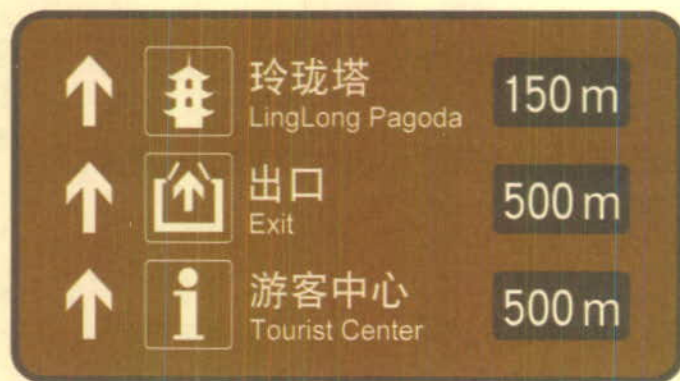
图2 空间位置与布局关系