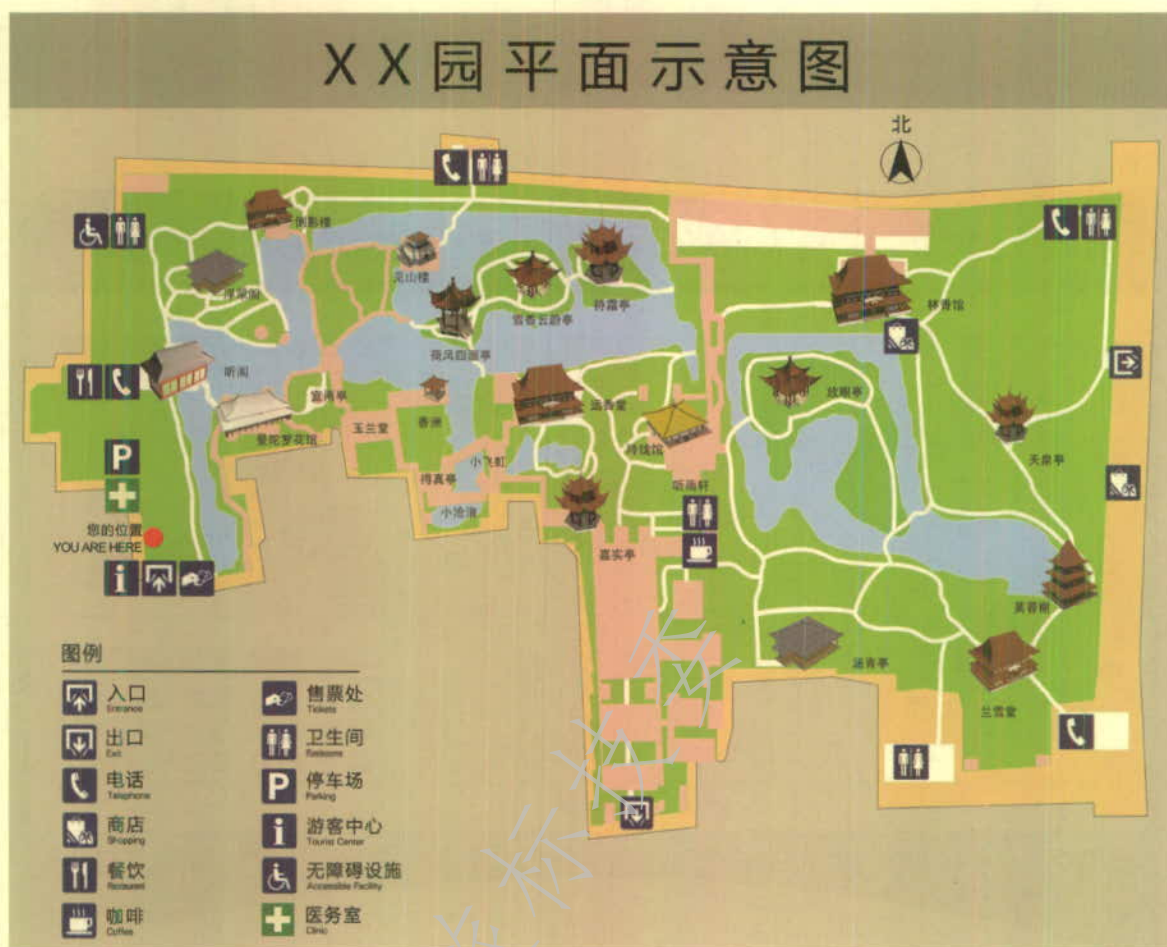
图 A.4 在平面示意图中采用三维图表示建筑物的示例